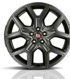
3CY Aluminijska CROSS felga 17"