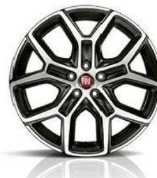
1M6 Aluminijska CROSS DIAMOND felga 17"