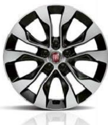
1M4 Aluminijska felga 16"