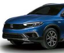
405 Plava "Oceano"