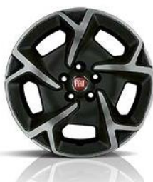
208 Stilizovane CROSS felge 16"