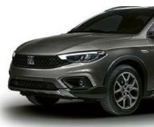
695 Tamno siva