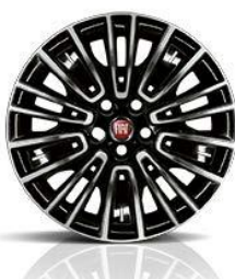
2XR Stilizovana felga 16"