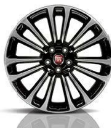
1M8 Aluminijska felga 17"